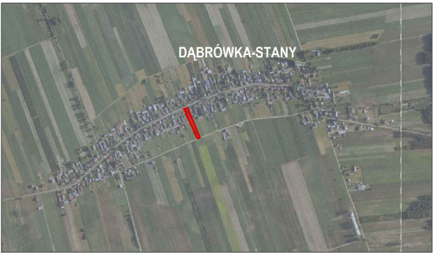
LOKALIZACJA DZIAŁKI NR EWID. 60 - OBRĘB EWID. DĄBRÓWKA-STANY, JEDNOSTKA EWID. GM. SKÓRZEC

PROJEKT ZAGOSPODAROWANIA DZIAŁKI NR EWID. 60 - OBRĘB DĄBRÓWKA-STANY, JEDNOSTKA EWID. GM. SKÓRZEC SKALA 1:500