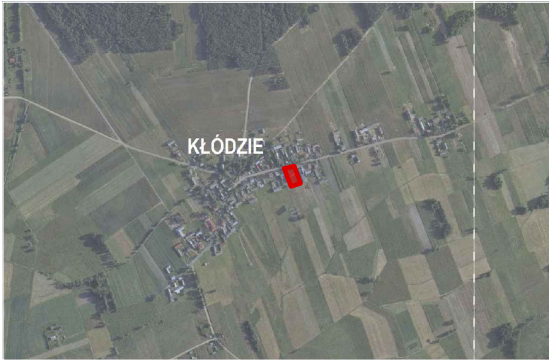
LOKALIZACJA DZIAŁKI NR EWID. 672 - OBRĘB EWID. KLÓDZIE, JEDNOSTKA EWID. GM. SKÓRZEC

LOKALIZACJA: jednostka ewid. 142609_2 gm. Skórzec, obręb ewid. 142609_2.0011 Klódzie, działka nr ewid. 672 We wsi Klódzie 77, 08-114 Skórzec