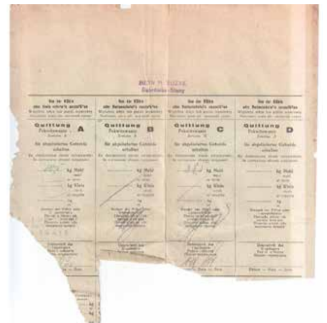
2. „Karta przemiałowa i wymienna dla samozaopatrujących się”.