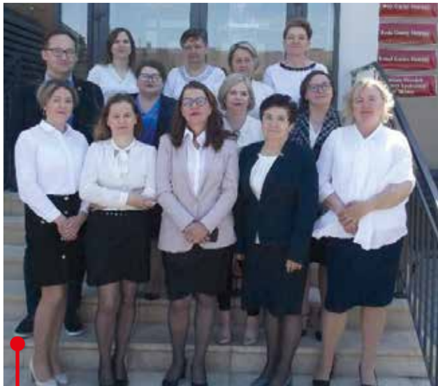
Kadra Gminnego Ośrodka Pomocy Społecznej w Skórcu