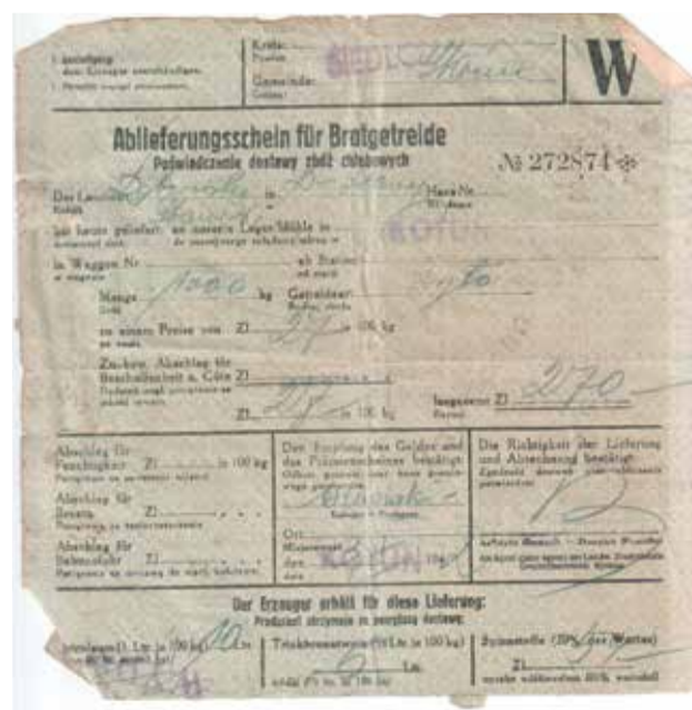
1. „Poświadczenie dostawy zbóż”

Pochodzenie nazwy Skórzec wywodzi się od słowa „skorc”, w formie rozszerzonej „skorzec”, oznaczało szpaka – „skory”, czyli przylatujący wczesną wiosną.