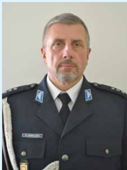
KOMENDANT KOMISARIATU POLICJI W SKÓRCU - KOM. MIROSŁAW KOWALCZYK