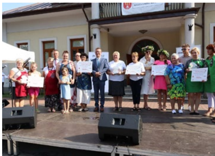
Laureaci konkursu „Pieczarkowe inspiracje”

Dożynki 2023 - najważniejsze święto dla rolników będące ukoronowaniem ich całorocznego trudu - w tym roku miały bardzo atrakcyjną i rozbudowaną formę. Tegoroczne Gminno-Parafialne Święto Rolników uatrakcyjnione było dwoma konkursami, w których wystartowały osoby zrzeszone w Kołach Gospodyń Wiejskich oraz aktywne społecznie w swoich środowiskach lokalnych.