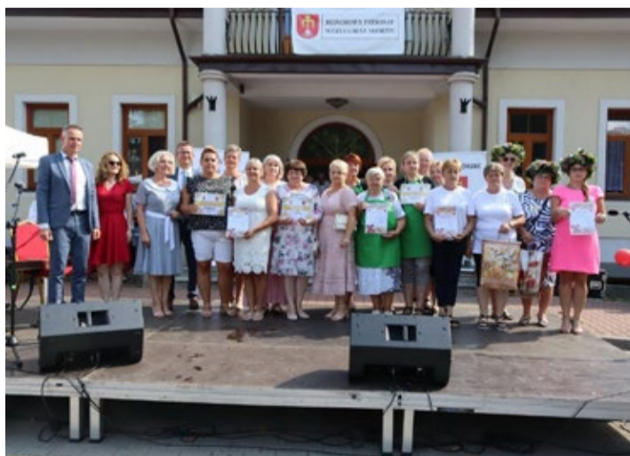
Laureaci konkursu na „Najładniejszy wieniec dożynkowy”