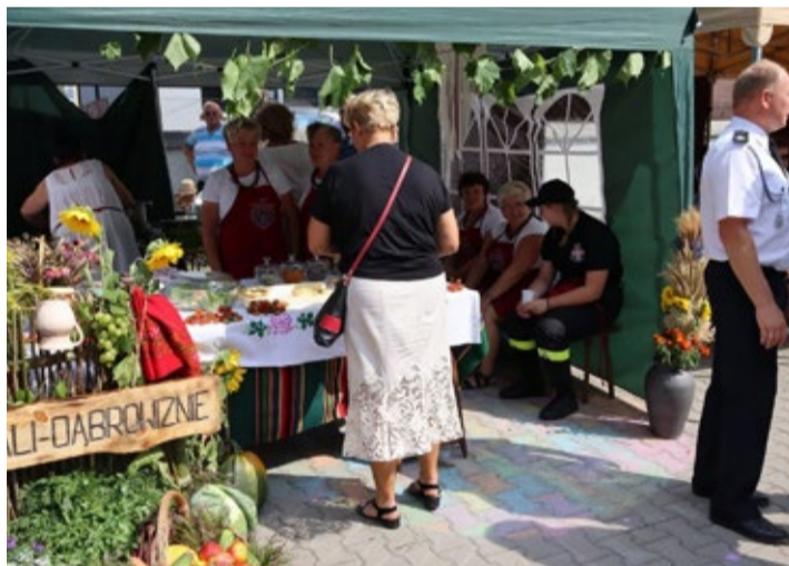
KGW w Grali-Dąbrówiznie