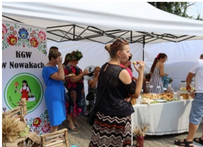
KGW w Nowakach