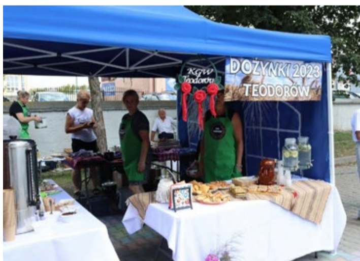
KGW w Teodorowie