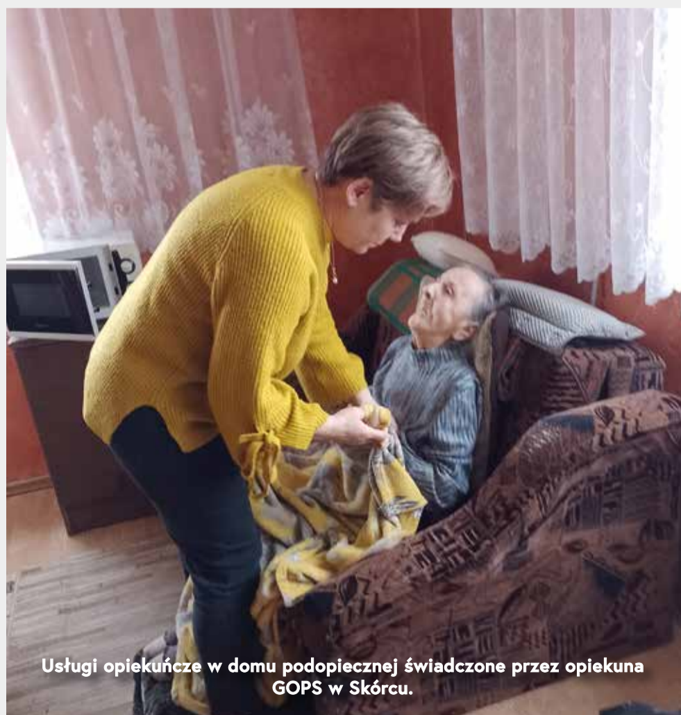
Usługi opiekuńcze w domu podopiecznej świadczone przez opiekuna GOPS w Skórcu.