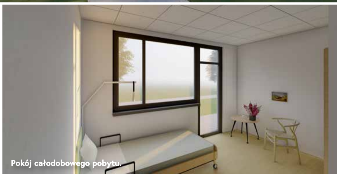
Pokój całodobowego pobytu.