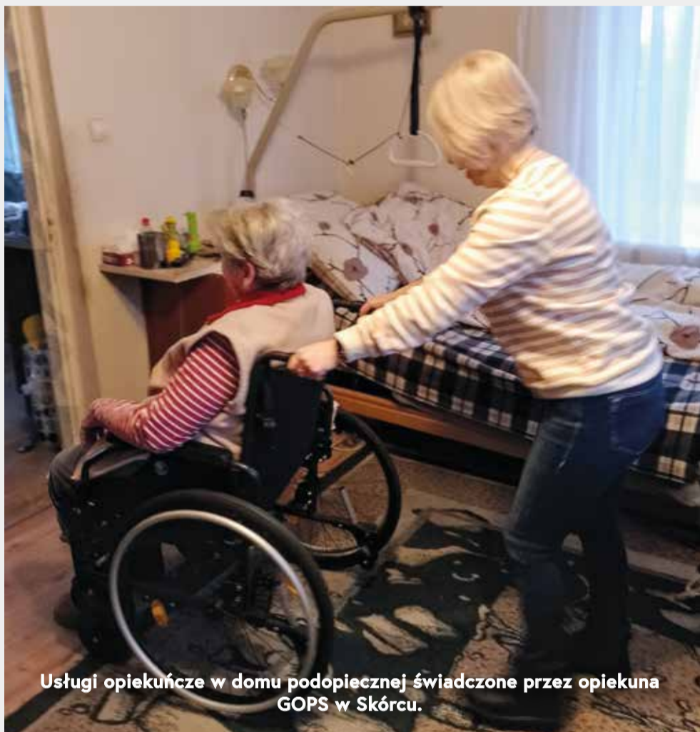
Usługi opiekuńcze w domu podopiecznej świadczone przez opiekuna GOPS w Skórcu.

COM jest innym od dotychczasowo funkcjonujących rozwiązań dla osób niepełnosprawnych, ponieważ stwarza nowe możliwości tj. zamieszkanie i usługi opiekuńcze w pobycie całodobowym i dziennym, w zależności od sytuacji rodzinnej uczestnika i jego stanu zdrowia.