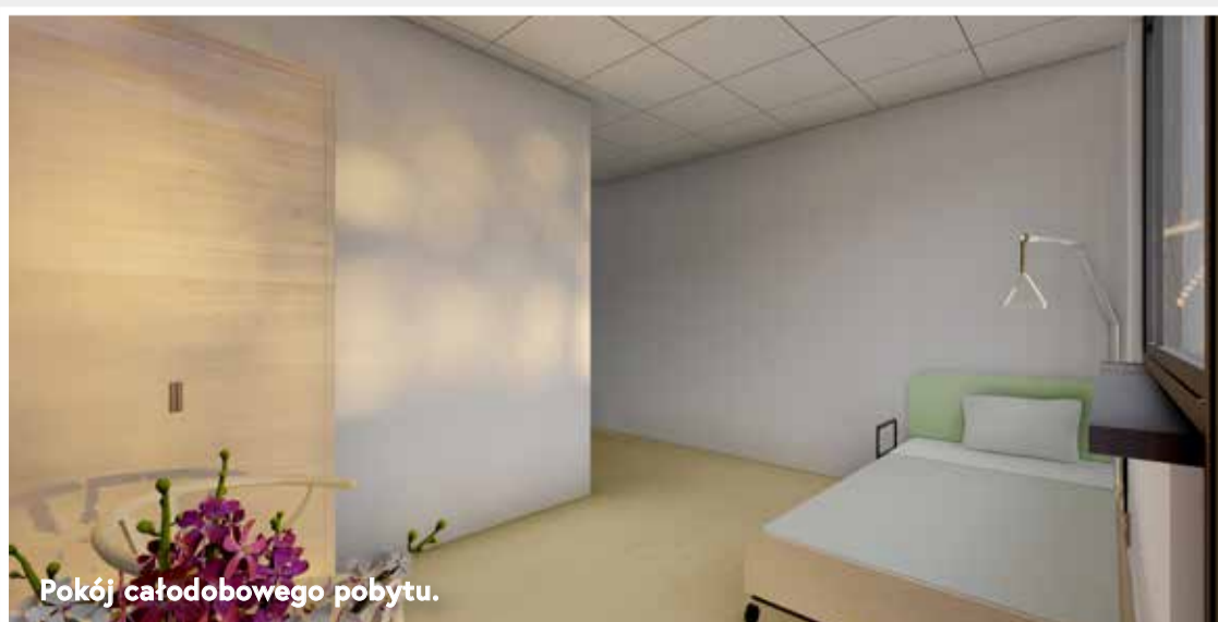
Pokój całodobowego pobytu.

Gmina Skórzec planuje zbudować nowy obiekt – Centrum Opiekuńczo-Mieszkalne o powierzchni całkowitej 519,95 m 2 i pow. użytkowa 441,98 m 2 , w miejscowości Grala-Dąbrowizna 52, będącej własnością gminy o powierzchni 0,26 ha z dostępem do drogi publicznej. Teren Centrum Opiekuńczo-Mieszkalnego będzie wyposażony w parkingi oraz siłownię plenerową. Jest to działka położona w spokojnej, wiejskiej okolicy.