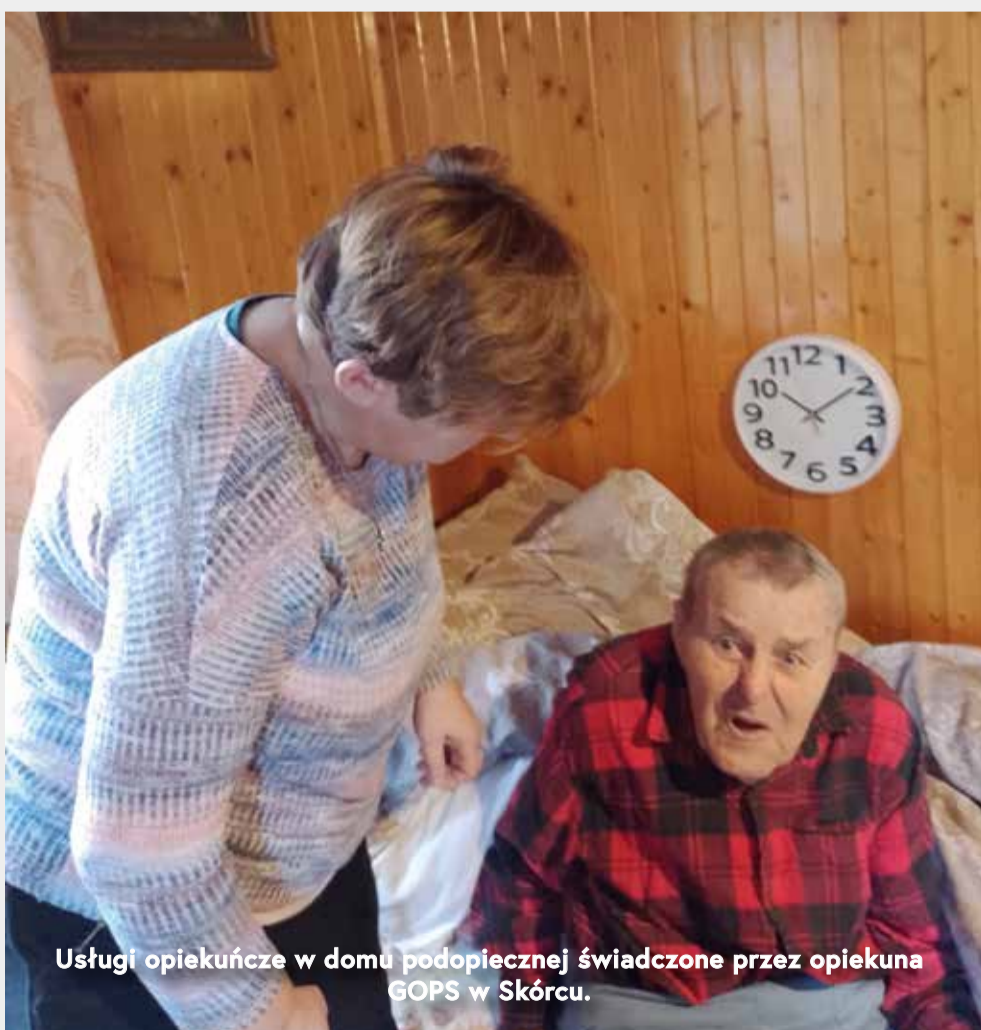
Usługi opiekuńcze w domu podopiecznej świadczone przez opiekuna GOPS w Skórcu.