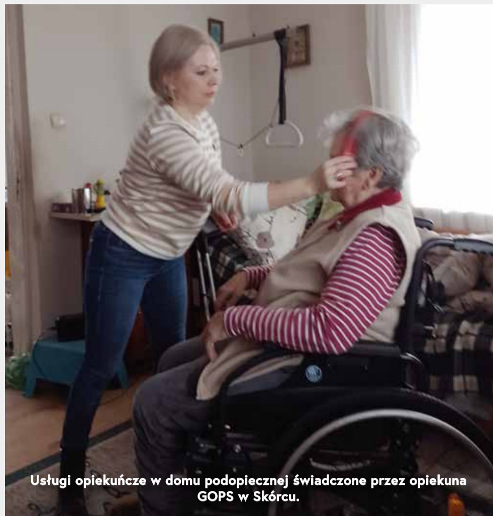
Usługi opiekuńcze w domu podopiecznej świadczone przez opiekuna GOPS w Skórcu.