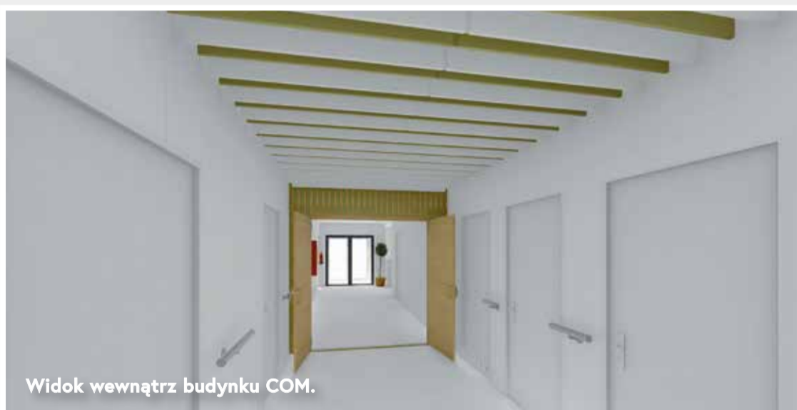
Widok wewnątrz budynku COM.