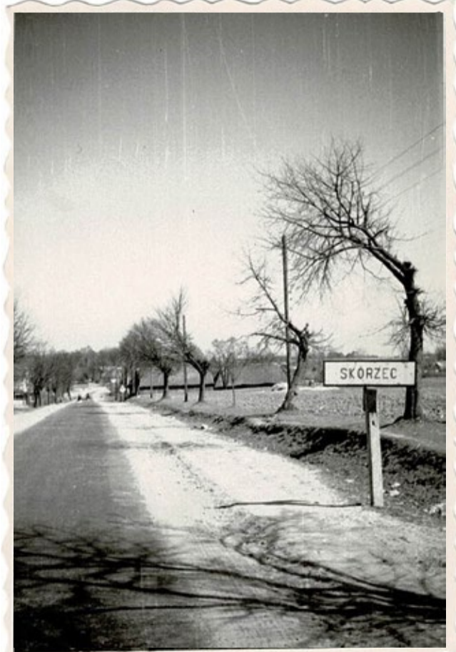
Skórzec – droga wojewódzka 803