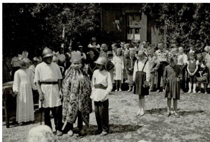
Szkoła Podstawowa w Skórcu, 1960 rok