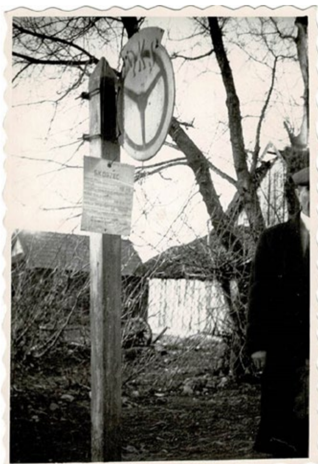
Przystanek PKS w Skórcu