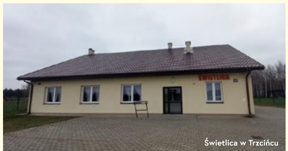
Świetlica w Trzciancu