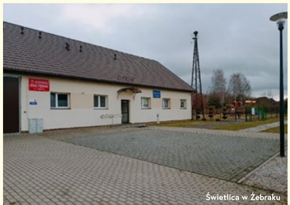
Świetlica w Żebraku

Załącznik Nr 1 do Zarządzenia Nr 70/24 Wójta Gminy Skórzec z dnia 12 września 2024 r. dotyczącego ustalenia stawek opłat za korzystanie ze świetlic wiejskich na terenie Gminy Skórzec i odpłatnego wypożyczenia ich wyposażenia oraz wzorów dokumentów