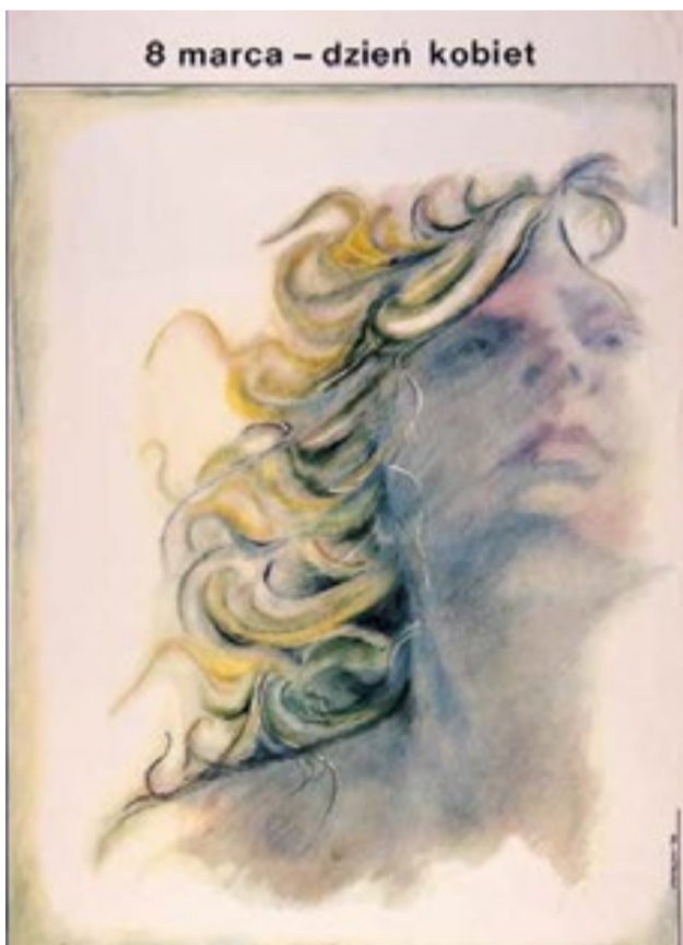
▲ 8 Marca – Dzień Kobiet, Wiesław Strebek, 1979, Nr Inw. MN-PI.4608

Międzynarodowy Dzień Kobiet przypomina o długiej drodze, jaką kobiety przebyły w walce o swoje prawa, że walka o równouprawnienie wciąż trwa, a także o wyzwaniach, które stoją przed społeczeństwem. Jest to też czas refleksji. Dzień ten podkreśla wagę solidarności i współpracy w dążeniu do świata, w którym kobiety i mężczyźni mają równe szanse i prawa.