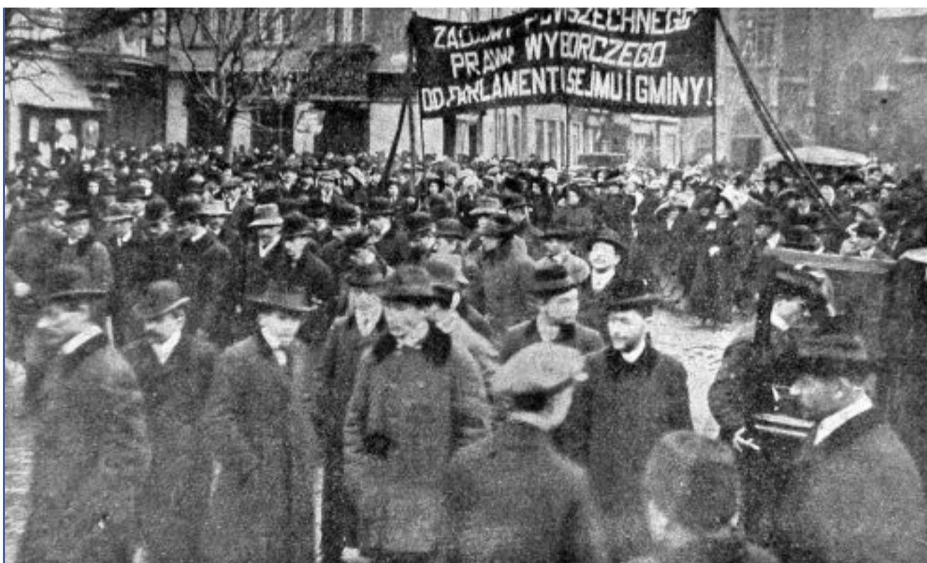
▲ Manifestacja sufrażystek w Dniu Kobiet - 1911 r.