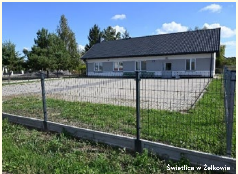
Świetlica w Żelkowie